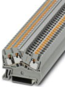
Durchgangsklemme, Anschlussart: Push-in-Anschluss, Querschnitt: 0,14 mm 2 - 4 mm 2 , AWG: 26 - 12, Breite: 5,2 mm, Farbe: grau, Montageart: NS 35/7,5, NS 35/15

Bitte beachten Sie, dass die hier angegebenen Daten dem Online-Katalog entnommen sind. Die vollständigen Informationen und Daten entnehmen Sie bitte der Anwenderdokumentation. Es gelten die Allgemeinen Nutzungsbedingungen für Internet-Downloads. ( http://download.phoenixcontact.de )