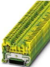
Schutzleiter-Reihenklemme, Anschlussart: Zugfeder- / Steckanschluss, Querschnitt: 0,08 mm 2 - 4 mm 2 , AWG: 28 - 12, Breite: 5,2 mm, Farbe: grün-gelb, Montageart: NS 35/7,5, NS 35/15

Bitte beachten Sie, dass die hier angegebenen Daten dem Online-Katalog entnommen sind. Die vollständigen Informationen und Daten entnehmen Sie bitte der Anwenderdokumentation. Es gelten die Allgemeinen Nutzungsbedingungen für Internet-Downloads. ( http://download.phoenixcontact.de )