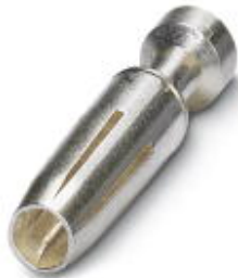
Gedrehter 2,5er Crimpkontakt, Buchsen-Einzelkontakt, Aderquerschnitt 0,5 mm 2 , versilbert

Bitte beachten Sie, dass die hier angegebenen Daten dem Online-Katalog entnommen sind. Die vollständigen Informationen und Daten entnehmen Sie bitte der Anwenderdokumentation. Es gelten die Allgemeinen Nutzungsbedingungen für Internet-Downloads. ( http://download.phoenixcontact.de )