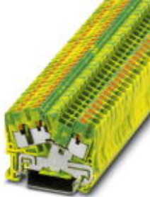
Schutzleiter-Reihenklemme, Anschlussart: Push-in-Anschluss, Querschnitt: 0,14 mm 2 - 4 mm 2 , AWG: 26 - 12, Breite: 5,2 mm, Farbe: grün-gelb, Montageart: NS 35/7,5, NS 35/15

Bitte beachten Sie, dass die hier angegebenen Daten dem Online-Katalog entnommen sind. Die vollständigen Informationen und Daten entnehmen Sie bitte der Anwenderdokumentation. Es gelten die Allgemeinen Nutzungsbedingungen für Internet-Downloads. ( http://download.phoenixcontact.de )