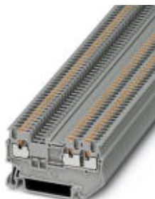
Durchgangsklemme, Anschlussart: Push-in-Anschluss, Querschnitt: 0,14 mm 2 - 1,5 mm 2 , AWG: 26 - 14, Breite: 3,5 mm, Höhe: 30,5 mm, Farbe: grau, Montageart: NS 35/7,5, NS 35/15

Bitte beachten Sie, dass die hier angegebenen Daten dem Online-Katalog entnommen sind. Die vollständigen Informationen und Daten entnehmen Sie bitte der Anwenderdokumentation. Es gelten die Allgemeinen Nutzungsbedingungen für Internet-Downloads. ( http://download.phoenixcontact.de )