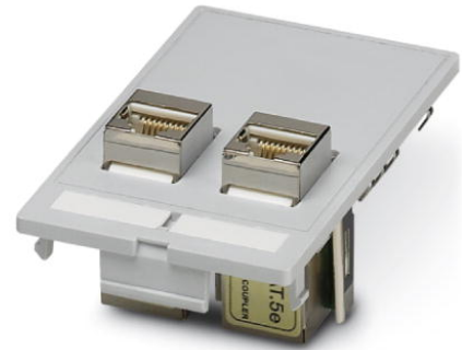
Abbildung zeigt die Produktvariante VS-SI-FP-2RJ45-5-MOD-BU/BU

http://eshop.phoenixcontact.de/phoenix/treeViewClick.do?UID=1657737