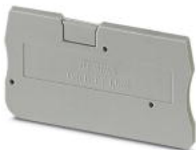
Abschlussdeckel, Länge: 45 mm, Breite: 2,2 mm, Höhe: 24,3 mm, Farbe: grau

Bitte beachten Sie, dass die hier angegebenen Daten dem Online-Katalog entnommen sind. Die vollständigen Informationen und Daten entnehmen Sie bitte der Anwenderdokumentation. Es gelten die Allgemeinen Nutzungsbedingungen für Internet-Downloads. ( http://download.phoenixcontact.de )