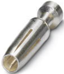
Gedrehter 2,5er Crimpkontakt, Buchsen-Einzelkontakt, Aderquerschnitt 4,00 mm 2 , versilbert

Bitte beachten Sie, dass die hier angegebenen Daten dem Online-Katalog entnommen sind. Die vollständigen Informationen und Daten entnehmen Sie bitte der Anwenderdokumentation. Es gelten die Allgemeinen Nutzungsbedingungen für Internet-Downloads. ( http://download.phoenixcontact.de )