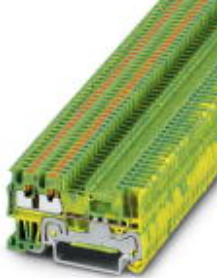
Schutzleiter-Reihenklemme, Anschlussart: Push-in- / Steckanschluss, Querschnitt: 0,14 mm 2 - 1,5 mm 2 , AWG: 26 - 14, Breite: 3,5 mm, Farbe: grün-gelb, Montageart: NS 35/7,5, NS 35/15

Bitte beachten Sie, dass die hier angegebenen Daten dem Online-Katalog entnommen sind. Die vollständigen Informationen und Daten entnehmen Sie bitte der Anwenderdokumentation. Es gelten die Allgemeinen Nutzungsbedingungen für Internet-Downloads. ( http://download.phoenixcontact.de )