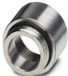
Abbildung zeigt die Variante HC-NPT-1/2-M20

Bitte beachten Sie, dass die hier angegebenen Daten dem Online-Katalog entnommen sind. Die vollständigen Informationen und Daten entnehmen Sie bitte der Anwenderdokumentation. Es gelten die Allgemeinen Nutzungsbedingungen für Internet-Downloads. ( http://download.phoenixcontact.de )