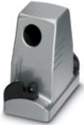
HEAVYCON ADVANCE Standard-Pulverbeschichtet, Tüllengehäuse B10, mit Bajonettverriegelung, Höhe 100 mm, mit Gewinde 1xM25, seitlichem Kabelabgang

Bitte beachten Sie, dass die hier angegebenen Daten dem Online-Katalog entnommen sind. Die vollständigen Informationen und Daten entnehmen Sie bitte der Anwenderdokumentation. Es gelten die Allgemeinen Nutzungsbedingungen für Internet-Downloads. ( http://download.phoenixcontact.de )