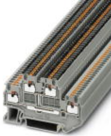
Doppelstock-Klemme, Querschnitt: 0,14 mm 2 - 1,5 mm 2 , AWG: 26 - 14, Anschlussart: Push-in-Anschluss, Breite: 3,5 mm, Farbe: grau, Montageart: NS 35/7,5, NS 35/15

Bitte beachten Sie, dass die hier angegebenen Daten dem Online-Katalog entnommen sind. Die vollständigen Informationen und Daten entnehmen Sie bitte der Anwenderdokumentation. Es gelten die Allgemeinen Nutzungsbedingungen für Internet-Downloads. ( http://download.phoenixcontact.de )