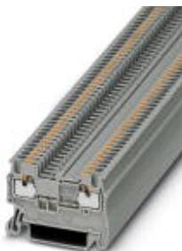
Durchgangsklemme, Anschlussart: Push-in-Anschluss, Querschnitt: 0,14 mm 2 - 1,5 mm 2 , AWG: 26 - 14, Breite: 3,5 mm, Höhe: 30,5 mm, Farbe: grau, Montageart: NS 35/7,5, NS 35/15

Bitte beachten Sie, dass die hier angegebenen Daten dem Online-Katalog entnommen sind. Die vollständigen Informationen und Daten entnehmen Sie bitte der Anwenderdokumentation. Es gelten die Allgemeinen Nutzungsbedingungen für Internet-Downloads. ( http://download.phoenixcontact.de )