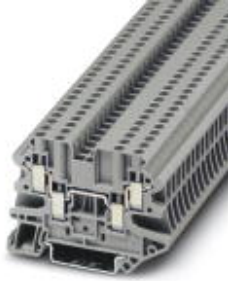
Durchgangsklemme, Anschlussart: Schraubanschluss, Querschnitt: 0,14 mm 2 - 4 mm 2 , AWG: 26 - 12, Breite: 5,2 mm, Farbe: grau, Montageart: NS 35/7,5, NS 35/15

Bitte beachten Sie, dass die hier angegebenen Daten dem Online-Katalog entnommen sind. Die vollständigen Informationen und Daten entnehmen Sie bitte der Anwenderdokumentation. Es gelten die Allgemeinen Nutzungsbedingungen für Internet-Downloads. ( http://download.phoenixcontact.de )