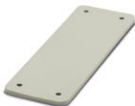
HEAVYCON Abdeckplatte, für Wandausschnitte der Bauform D25, Dicke 3,5 mm, grau

Bitte beachten Sie, dass die hier angegebenen Daten dem Online-Katalog entnommen sind. Die vollständigen Informationen und Daten entnehmen Sie bitte der Anwenderdokumentation. Es gelten die Allgemeinen Nutzungsbedingungen für Internet-Downloads. ( http://download.phoenixcontact.de )