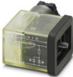
Ventilstecker, 3-polig, Bauform BI, 1 LED, mit Schutzbeschaltung, Schraubanschluss, Kabelverschraubung M16

Bitte beachten Sie, dass die hier angegebenen Daten dem Online-Katalog entnommen sind. Die vollständigen Informationen und Daten entnehmen Sie bitte der Anwenderdokumentation. Es gelten die Allgemeinen Nutzungsbedingungen für Internet-Downloads. ( http://download.phoenixcontact.de )