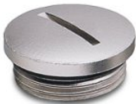
Blindstopfen, für Pg-Verschraubungen, Pg-Typ 21

Bitte beachten Sie, dass die hier angegebenen Daten dem Online-Katalog entnommen sind. Die vollständigen Informationen und Daten entnehmen Sie bitte der Anwenderdokumentation. Es gelten die Allgemeinen Nutzungsbedingungen für Internet-Downloads. ( http://download.phoenixcontact.de )