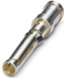
Gedrehter 1,6er Crimpkontakt, Buchsen-Einzelkontakt, Aderquerschnitt 1,5 mm 2 , versilbert

Bitte beachten Sie, dass die hier angegebenen Daten dem Online-Katalog entnommen sind. Die vollständigen Informationen und Daten entnehmen Sie bitte der Anwenderdokumentation. Es gelten die Allgemeinen Nutzungsbedingungen für Internet-Downloads. ( http://download.phoenixcontact.de )