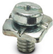
PE- Schraube, für Kontakteinsätze HC-B / HC-BB / HC-DD / HC-D40 / HC-D64

Bitte beachten Sie, dass die hier angegebenen Daten dem Online-Katalog entnommen sind. Die vollständigen Informationen und Daten entnehmen Sie bitte der Anwenderdokumentation. Es gelten die Allgemeinen Nutzungsbedingungen für Internet-Downloads. ( http://download.phoenixcontact.de )