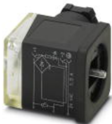
Ventilstecker, 3-polig, Bauform A, 1 LED, mit Schutzbeschaltung: Varistor und Gleichrichter, Schraubanschluss, Kabelverschraubung M16

Bitte beachten Sie, dass die hier angegebenen Daten dem Online-Katalog entnommen sind. Die vollständigen Informationen und Daten entnehmen Sie bitte der Anwenderdokumentation. Es gelten die Allgemeinen Nutzungsbedingungen für Internet-Downloads. ( http://download.phoenixcontact.de )