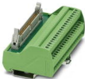
VARIOFACE-Übergabemodul, für I/Os der SIMATIC® S7-400, mit SIMATIC® -spezifischer Beschriftung, nur in Verbindung mit FLKM 50-PA-S400

Bitte beachten Sie, dass die hier angegebenen Daten dem Online-Katalog entnommen sind. Die vollständigen Informationen und Daten entnehmen Sie bitte der Anwenderdokumentation. Es gelten die Allgemeinen Nutzungsbedingungen für Internet-Downloads. ( http://download.phoenixcontact.de )