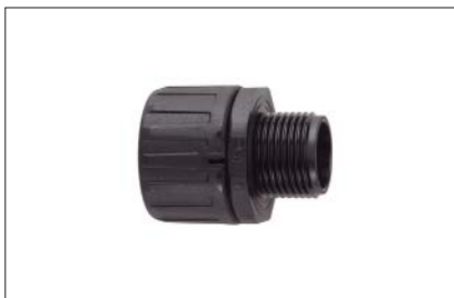
HelaGuard HG-S, gerade Verschraubung mit Außengewinde.

Verschraubungen mit UNEF- und NPT-Gewinde auf Anfrage erhältlich. Fragen Sie uns!