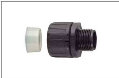
HelaGuard HGL-S, gerade Verschraubung mit Außengewinde inkl. Schlauchdichtung.