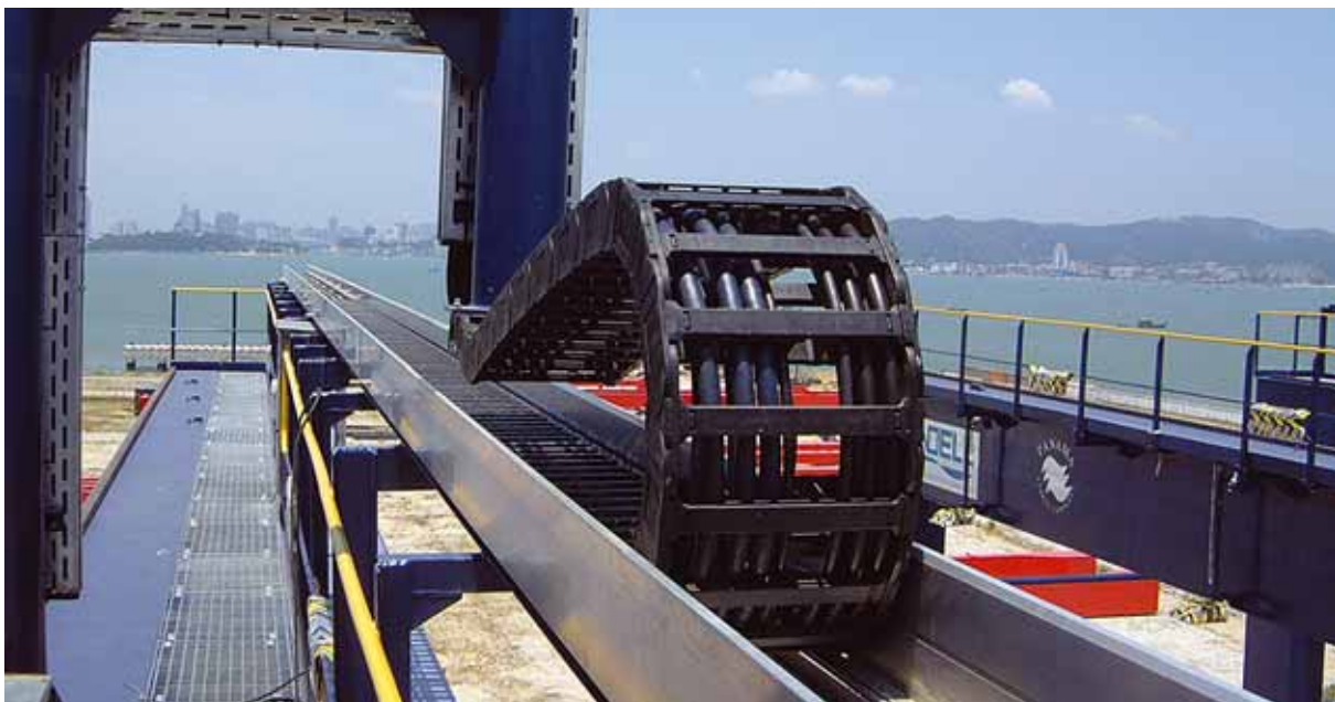
Chainflex® CF9 für Outdoor-Krananlagen. E-Kette®: Serie E4/00