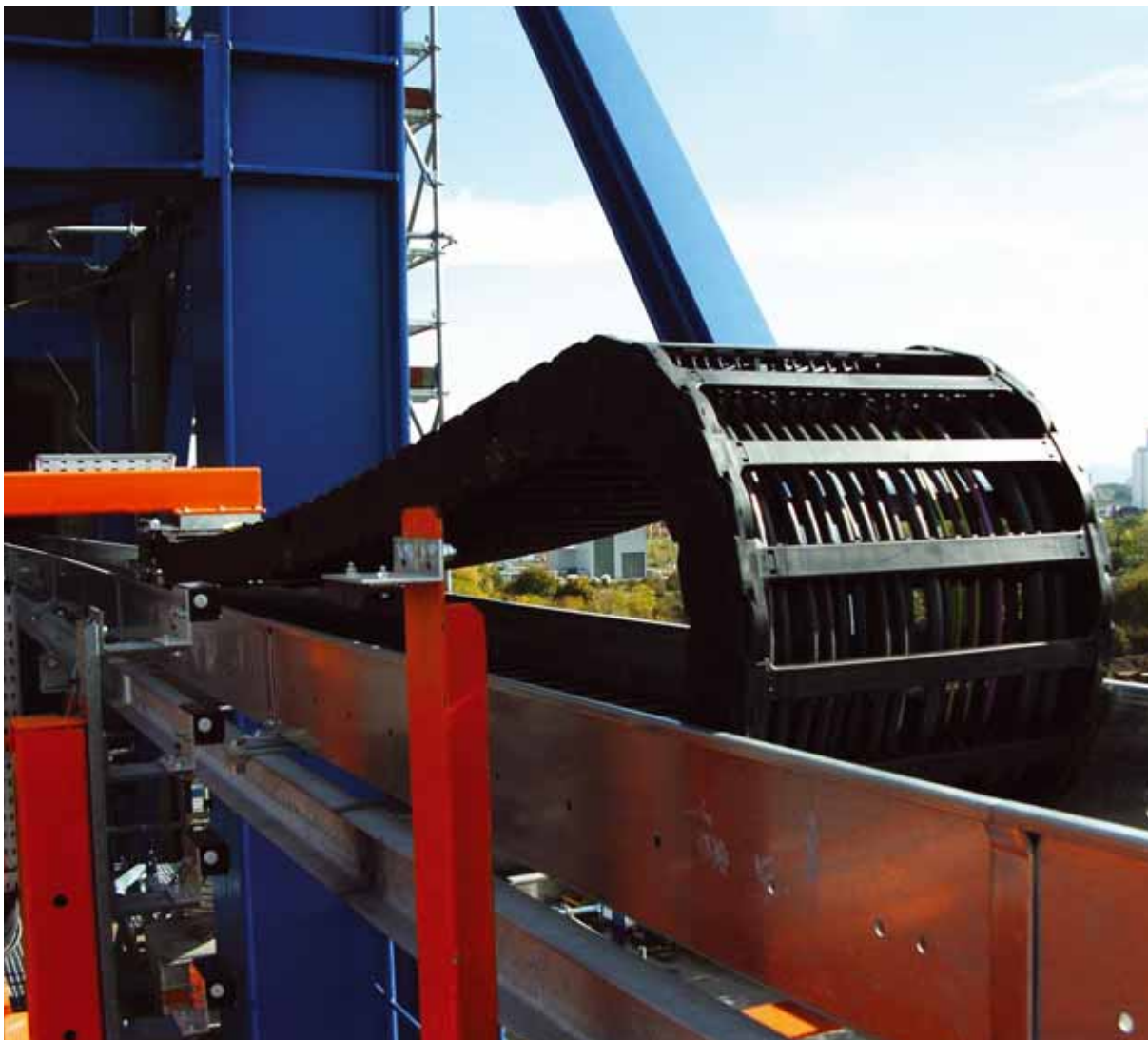
Chainflex® CF9 für höchste Beanspruchung bei In- und Outdooranwendungen. E-Kette®: System E4/4

Hinweis: Die angegebenen Außendurchmesser sind Maximalwerte und können nach unten tolerieren. * Nennspannung 600/1000 V ** Nennspannung 450/750 V G = mit Schutzleiter grüngelb x = ohne Schutzleiter