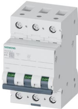
Leitungsschutzschalter 400V 6kA, 3-polig, B, 16A