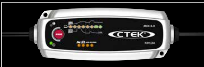
CTEK MXS 5.0 Ladegerät