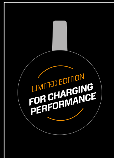
Regalstopper 100 x 100 mm