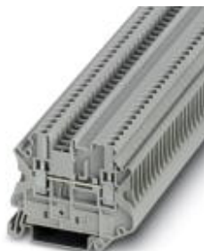
Durchgangsklemme, Anschlussart: Schraubanschluss, Querschnitt: 0,14 mm 2 - 4 mm 2 , AWG: 26 - 12, Breite: 5,2 mm, Farbe: grau, Montageart: NS 35/7,5, NS 35/15

Bitte beachten Sie, dass die hier angegebenen Daten dem Online-Katalog entnommen sind. Die vollständigen Informationen und Daten entnehmen Sie bitte der Anwenderdokumentation. Es gelten die Allgemeinen Nutzungsbedingungen für Internet-Downloads. ( http://download.phoenixcontact.de )