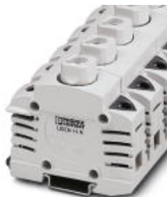
Sicherungsklemmen für NEOZED-Sicherungseinsätze

Bitte beachten Sie, dass die hier angegebenen Daten dem Online-Katalog entnommen sind. Die vollständigen Informationen und Daten entnehmen Sie bitte der Anwenderdokumentation. Es gelten die Allgemeinen Nutzungsbedingungen für Internet-Downloads. ( http://download.phoenixcontact.de )