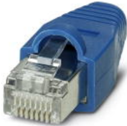
Stecker RJ45, CAT5e, 8-polig, geschirmt, IDC-Anschluss-technik, für Litze und starre Ader AWG 26...24, mit blauer Knickschutztüle

Bitte beachten Sie, dass die hier angegebenen Daten dem Online-Katalog entnommen sind. Die vollständigen Informationen und Daten entnehmen Sie bitte der Anwenderdokumentation. Es gelten die Allgemeinen Nutzungsbedingungen für Internet-Downloads. ( http://download.phoenixcontact.de )