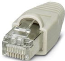
Stecker RJ45, CAT5e, 8-polig, geschirmt, IDC-Anschluss-technik, für Litze und starre Ader AWG 26...24, mit grauer Knickschutztülle

Bitte beachten Sie, dass die hier angegebenen Daten dem Online-Katalog entnommen sind. Die vollständigen Informationen und Daten entnehmen Sie bitte der Anwenderdokumentation. Es gelten die Allgemeinen Nutzungsbedingungen für Internet-Downloads. ( http://download.phoenixcontact.de )