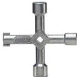
Schaltschrankschlüssel, aus Metall, für alle gängigen Schaltschränke

Bitte beachten Sie, dass die hier angegebenen Daten dem Online-Katalog entnommen sind. Die vollständigen Informationen und Daten entnehmen Sie bitte der Anwenderdokumentation. Es gelten die Allgemeinen Nutzungsbedingungen für Internet-Downloads. ( http://download.phoenixcontact.de )