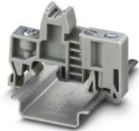
Endhalter, zur Montage auf Tragschiene NS 32 oder NS 35/7,5

Bitte beachten Sie, dass die hier angegebenen Daten dem Online-Katalog entnommen sind. Die vollständigen Informationen und Daten entnehmen Sie bitte der Anwenderdokumentation. Es gelten die Allgemeinen Nutzungsbedingungen für Internet-Downloads. ( http://download.phoenixcontact.de )