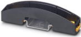
Unterteil für Installationsgehäuse BC 17,8...

Bitte beachten Sie, dass die hier angegebenen Daten dem Online-Katalog entnommen sind. Die vollständigen Informationen und Daten entnehmen Sie bitte der Anwenderdokumentation. Es gelten die Allgemeinen Nutzungsbedingungen für Internet-Downloads. ( http://download.phoenixcontact.de )