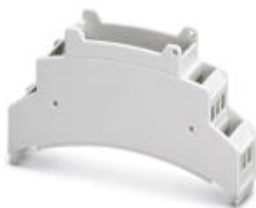
Oberteil für Installationsgehäuse BC, vorbereitet für den Einsatz von MKDSO-Anschluss-technik, Breite: 17,8 mm

Bitte beachten Sie, dass die hier angegebenen Daten dem Online-Katalog entnommen sind. Die vollständigen Informationen und Daten entnehmen Sie bitte der Anwenderdokumentation. Es gelten die Allgemeinen Nutzungsbedingungen für Internet-Downloads. ( http://download.phoenixcontact.de )