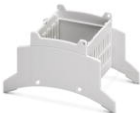
Oberteil für Installationsgehäuse BC, Breite: 53,6 mm, Anschlussraumtiefe: 22 mm

Bitte beachten Sie, dass die hier angegebenen Daten dem Online-Katalog entnommen sind. Die vollständigen Informationen und Daten entnehmen Sie bitte der Anwenderdokumentation. Es gelten die Allgemeinen Nutzungsbedingungen für Internet-Downloads. ( http://download.phoenixcontact.de )