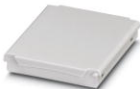
Deckel für Installationsgehäuse BC 53,6...

Bitte beachten Sie, dass die hier angegebenen Daten dem Online-Katalog entnommen sind. Die vollständigen Informationen und Daten entnehmen Sie bitte der Anwenderdokumentation. Es gelten die Allgemeinen Nutzungsbedingungen für Internet-Downloads. ( http://download.phoenixcontact.de )