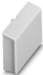
Blindstück 53,6 mm

Bitte beachten Sie, dass die hier angegebenen Daten dem Online-Katalog entnommen sind. Die vollständigen Informationen und Daten entnehmen Sie bitte der Anwenderdokumentation. Es gelten die Allgemeinen Nutzungsbedingungen für Internet-Downloads. ( http://download.phoenixcontact.de )