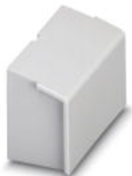
Blindstück 53,6 mm

Bitte beachten Sie, dass die hier angegebenen Daten dem Online-Katalog entnommen sind. Die vollständigen Informationen und Daten entnehmen Sie bitte der Anwenderdokumentation. Es gelten die Allgemeinen Nutzungsbedingungen für Internet-Downloads. ( http://download.phoenixcontact.de )