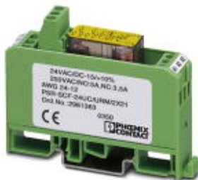
Universal-Sicherheitsrelais mit zwangsgeführten Kontakten, zwei Wechslerkontakte, für U_N 24 V AC/DC

Bitte beachten Sie, dass die hier angegebenen Daten dem Online-Katalog entnommen sind. Die vollständigen Informationen und Daten entnehmen Sie bitte der Anwenderdokumentation. Es gelten die Allgemeinen Nutzungsbedingungen für Internet-Downloads. ( http://download.phoenixcontact.de )