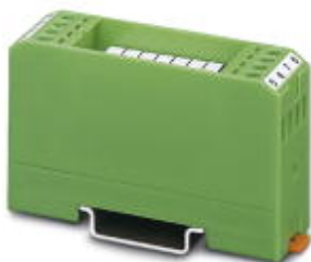
Anzeige-Modul, mit 7 roten LEDs und gemeinsamer Rückleitung, Eingangsspannung 24 V DC

Bitte beachten Sie, dass die hier angegebenen Daten dem Online-Katalog entnommen sind. Die vollständigen Informationen und Daten entnehmen Sie bitte der Anwenderdokumentation. Es gelten die Allgemeinen Nutzungsbedingungen für Internet-Downloads. ( http://download.phoenixcontact.de )