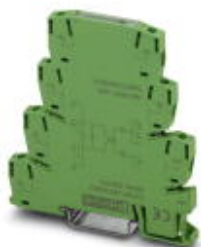
PLC-INTERFACE, integriertes Solid-State-Relais, mit Schraubanschluss, zur Montage auf Tragschiene NS 35/7,5, Eingang: 24 V DC, Ausgang: 12-300 V DC/1 A

Bitte beachten Sie, dass die hier angegebenen Daten dem Online-Katalog entnommen sind. Die vollständigen Informationen und Daten entnehmen Sie bitte der Anwenderdokumentation. Es gelten die Allgemeinen Nutzungsbedingungen für Internet-Downloads. ( http://download.phoenixcontact.de )