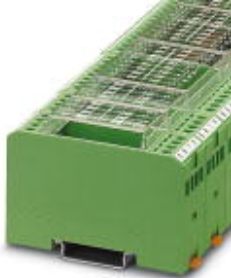
Dioden-Modul, zur Erweiterung mit 14 Dioden 1N 4007, mit gemeinsamer Kathode

Bitte beachten Sie, dass die hier angegebenen Daten dem Online-Katalog entnommen sind. Die vollständigen Informationen und Daten entnehmen Sie bitte der Anwenderdokumentation. Es gelten die Allgemeinen Nutzungsbedingungen für Internet-Downloads. ( http://download.phoenixcontact.de )