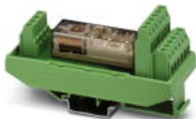
Universal-Sicherheitsrelais mit zwangsgeführten Kontakten, Schraubanschluss, 4 Schließer, 2 Öffner, Breite: 40 mm

Bitte beachten Sie, dass die hier angegebenen Daten dem Online-Katalog entnommen sind. Die vollständigen Informationen und Daten entnehmen Sie bitte der Anwenderdokumentation. Es gelten die Allgemeinen Nutzungsbedingungen für Internet-Downloads. ( http://download.phoenixcontact.de )