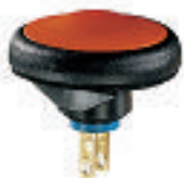
Snap-in IFB3Z1AD NO