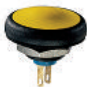
Mit Gewindebuchse IFS3Z1AD NO