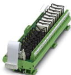
VARIOFACE-Ausgabeerweiterungsmodul, mit 16 Miniaturrelais, je 1 Wechsler, gesteckt, für 24 V DC (inkl. Relais)

Bitte beachten Sie, dass die hier angegebenen Daten dem Online-Katalog entnommen sind. Die vollständigen Informationen und Daten entnehmen Sie bitte der Anwenderdokumentation. Es gelten die Allgemeinen Nutzungsbedingungen für Internet-Downloads. ( http://download.phoenixcontact.de )