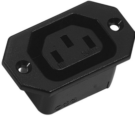
Gerätesteckdose, Längsflansch. Alte K+B Serie 704