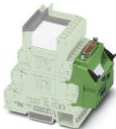
V8-OUTPUT-Adapter für acht 6,2 mm PLC Interfaces (1 Wechsler, etc./siehe „Ergänzende Produkte“). 15-polige D-SUB-Stiftleiste, Ansteuerlogik: plusschaltend

Bitte beachten Sie, dass die hier angegebenen Daten dem Online-Katalog entnommen sind. Die vollständigen Informationen und Daten entnehmen Sie bitte der Anwenderdokumentation. Es gelten die Allgemeinen Nutzungsbedingungen für Internet-Downloads. ( http://download.phoenixcontact.de )