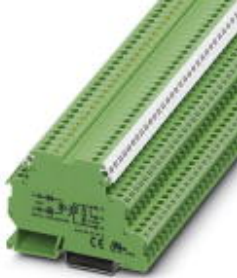
Leistungs-Solid-State-Relaisklemme, Eingang: 24 V DC, Ausgang: 10-253 V AC/800 mA, Klemmenbreite 6,2 mm

Bitte beachten Sie, dass die hier angegebenen Daten dem Online-Katalog entnommen sind. Die vollständigen Informationen und Daten entnehmen Sie bitte der Anwenderdokumentation. Es gelten die Allgemeinen Nutzungsbedingungen für Internet-Downloads. ( http://download.phoenixcontact.de )