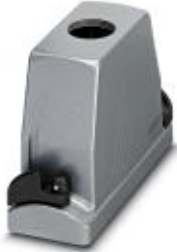
HEAVYCON ADVANCE Standard-Pulverbeschichtet, Tüllengehäuse B24, mit Bajonettverriegelung, Höhe 100 mm, mit Gewinde 1x M40, geradem Kabelabgang

Bitte beachten Sie, dass die hier angegebenen Daten dem Online-Katalog entnommen sind. Die vollständigen Informationen und Daten entnehmen Sie bitte der Anwenderdokumentation. Es gelten die Allgemeinen Nutzungsbedingungen für Internet-Downloads. ( http://download.phoenixcontact.de )