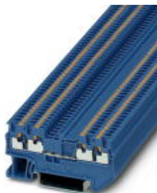
Durchgangsklemme, Anschlussart: Push-in-Anschluss, Querschnitt: 0,14 mm 2 - 1,5 mm 2 , AWG: 26 - 16, Breite: 3,5 mm, Farbe: blau, Montageart: NS 35/7,5, NS 35/15

Bitte beachten Sie, dass die hier angegebenen Daten dem Online-Katalog entnommen sind. Die vollständigen Informationen und Daten entnehmen Sie bitte der Anwenderdokumentation. Es gelten die Allgemeinen Nutzungsbedingungen für Internet-Downloads. ( http://download.phoenixcontact.de )